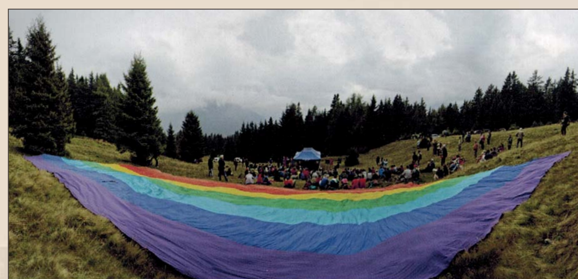
■ Il raduno di Pla lónc nel settembre 2013

Ogni anno, il 3 di luglio, Cevo ricorda l'incendio che distrusse il paese e la lotta che vide i suoi abitanti raccolti attorno ai partigiani della 54ª Brigata Garibaldi.