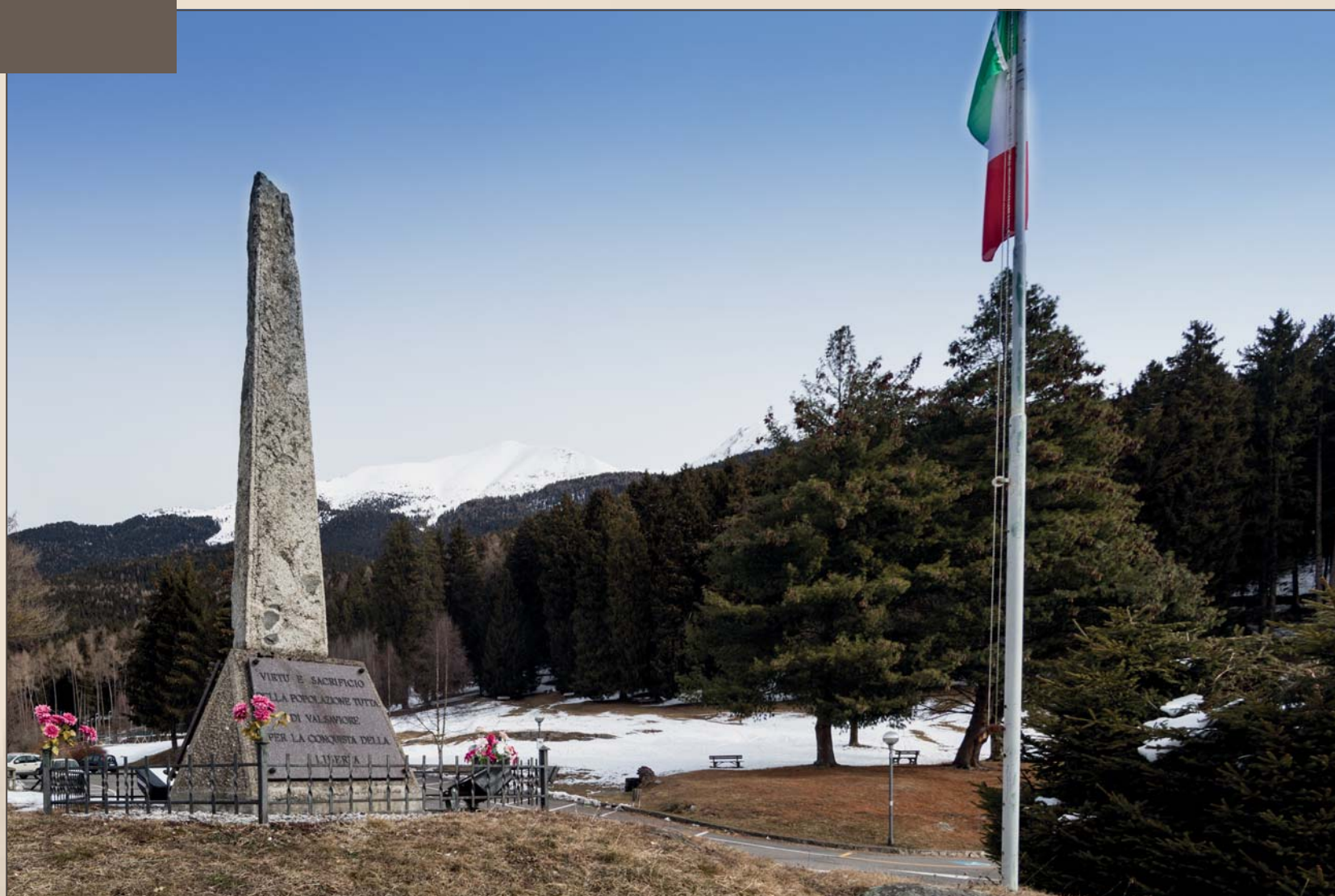
■ Il monolito di granito eretto nel 1979 a ricordo dell'incendio di Cevo

Ogni anno, il 3 di luglio, Cevo ricorda l'incendio che distrusse il paese e la lotta che vide i suoi abitanti raccolti attorno ai partigiani della 54ª Brigata Garibaldi.