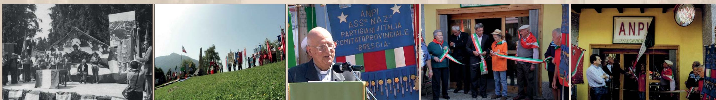
■ Momenti della manifestazione che ogni anno si organizza a Cevo il 3 luglio e l'inaugurazione della sede ANPI Valsaviore nel 2013

Altra occasione di raduno è quella del 3 settembre al Pla lónc, una vasta radura sopra il paese dove si svolse l'incontro tra combattenti e civili che nel 1944, due mesi dopo la distruzione del paese, confermò la volontà di continuare la lotta di liberazione.