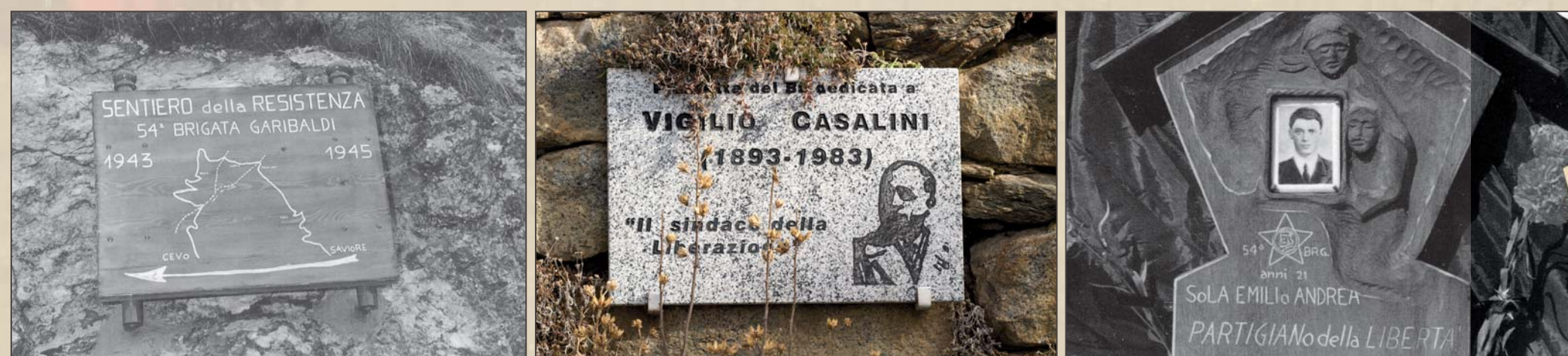
■ Segni della memoria della Resistenza a Cevo e Saviore