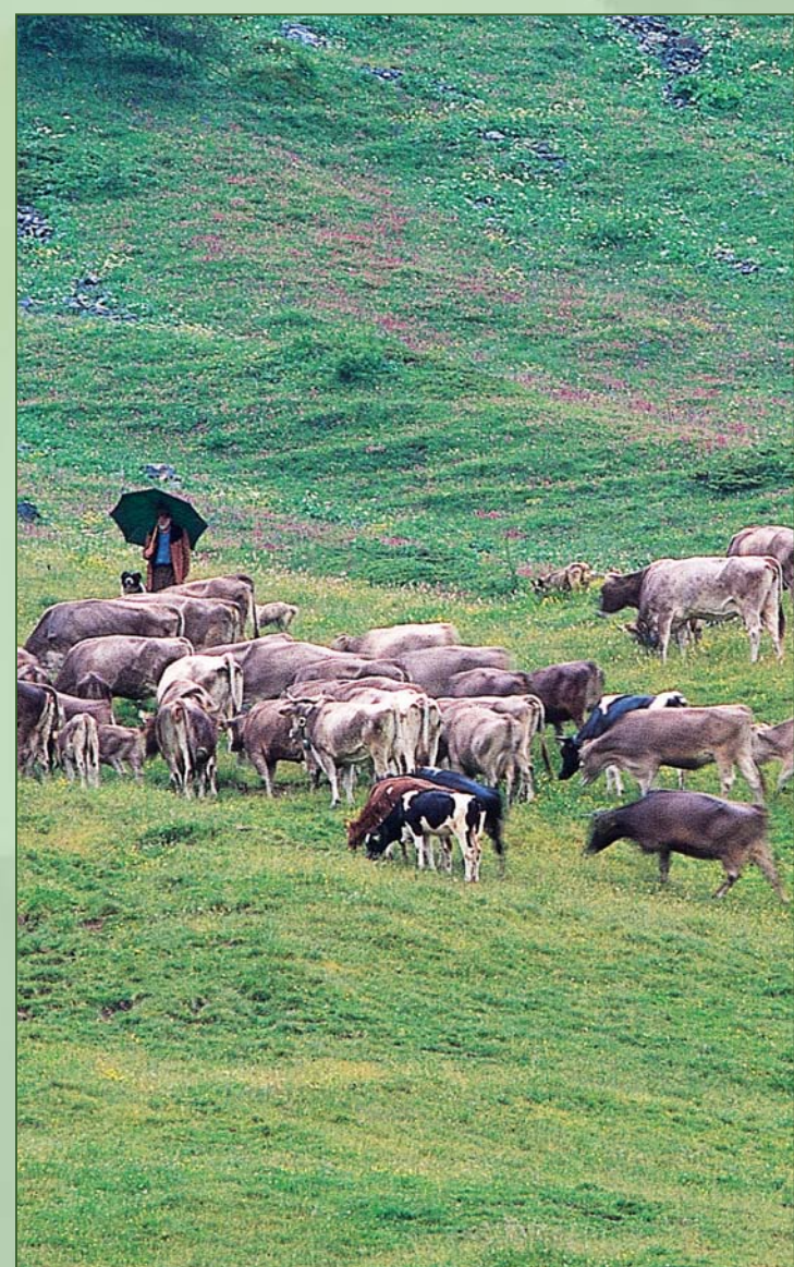
■ Il pascolo alpino