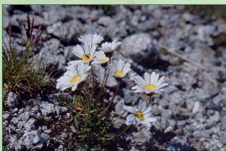
■ Il crisantemo alpino

Verso i 2.300 metri si estendono i pascoli alpini, ricchi di genziane, pulsatile, soldanelle e stelle alpine. A quota più elevata, compaiono muschi e licheni, che continuano nella fascia del deserto nivale dove sono presenti il crisantemo alpino, il ranuncolo dei ghiacciai e le sassifraghe.