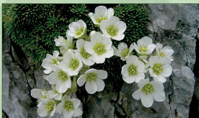
■ Il ranuncolo dei ghiacciai