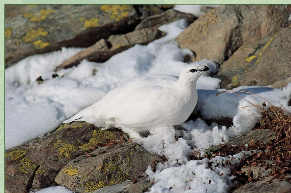
■ Il gallo cedrone e la pernice bianca