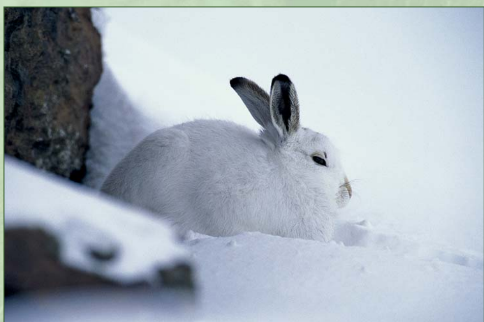
■ Il cervo, lo stambecco, la lepre alpina

Nel territorio del Parco vivono la lepre alpina, la marmotta, la donnola, l'ermellino, la volpe, la faina, lo scoiattolo, il ghio, il riccio, il toporagno alpino e l'arvicola delle nevi. Più rari la martora, la puzzola, il tasso.