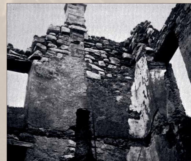
L'incendio di Cevo