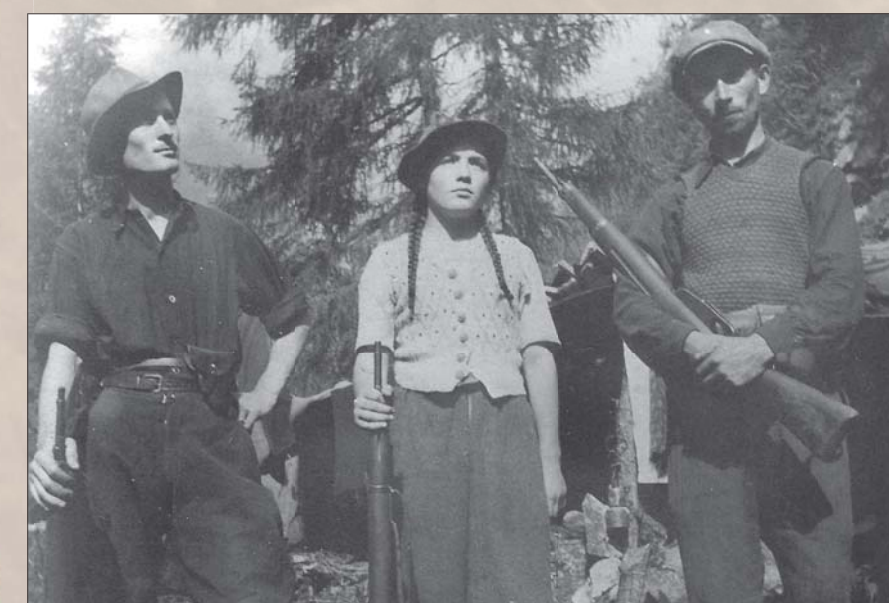
I protagonisti della Resistenza in Valsavioire