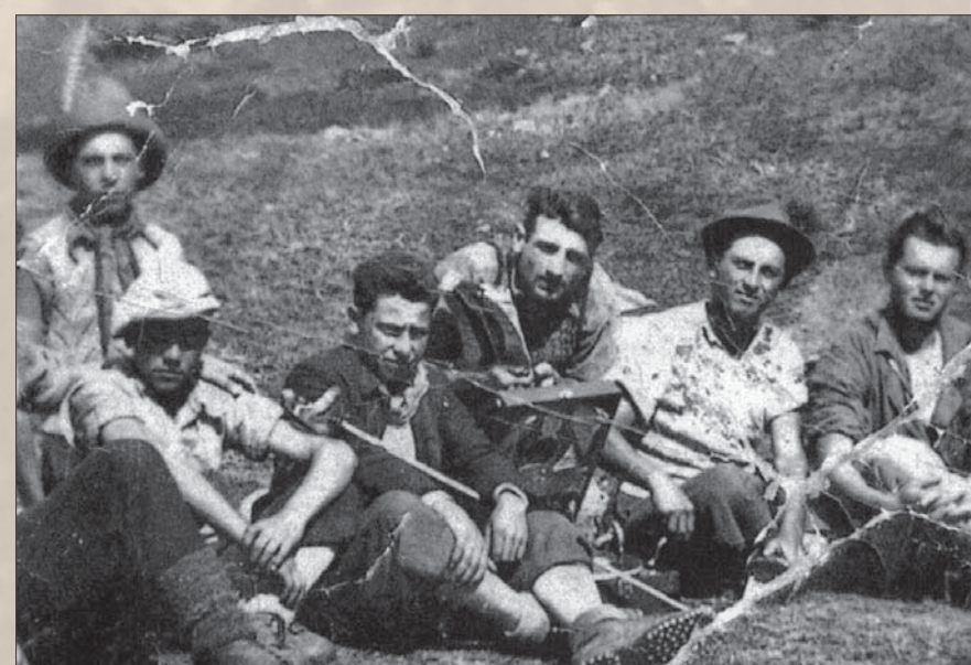
I Garibaldini e la lotta partigiana in Valsavioire

Il Museo ricostruisce la storia degli eventi accaduti in Valsavioire nel periodo dal 1943 al 1945 e dei fatti che portarono alla distruzione del paese di Cevo il 3 luglio 1944, proponendosi come punto di riferimento per la raccolta e la salvaguardia delle fonti documentarie sul periodo storico della Resistenza, in particolare nei territori della Valsavioire, della Valle Camonica e della provincia di Brescia, nel ricordo dei protagonisti di quei giorni.