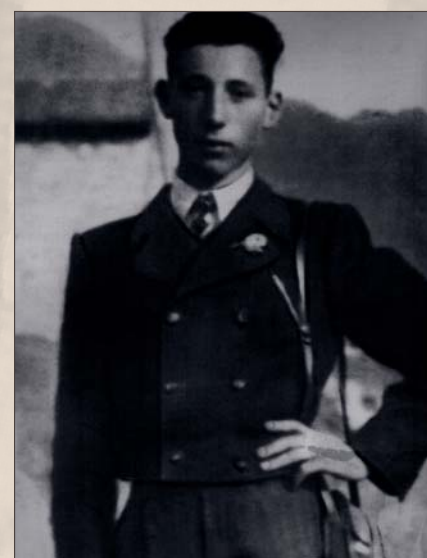
Il prezzo della libertà. I caduti. I deportati