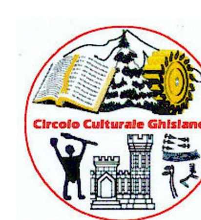
Circolo Culturale Ghitlandi