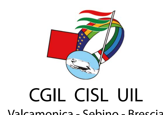
CGIL CISL UIL Valcamonica - Sebino - Brescia