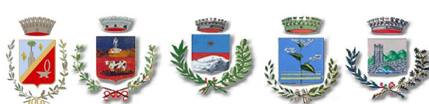
UNIONE COMUNI DELLA VALSAVIORE