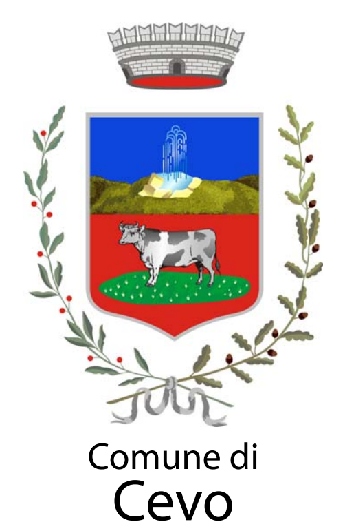
Comune di Cevo

Il Museo ricostruisce la storia degli eventi accaduti in Valsaviore nel periodo dal 1943 al 1945 e dei fatti che portarono alla distruzione del paese di Cevo il 3 luglio 1944, proponendosi come punto di riferimento per la raccolta e la salvaguardia delle fonti documentarie sul periodo storico della Resistenza, in particolare nei territori della Valsaviore, della Valle Camonica e della provincia di Brescia, nel ricordo dei protagonisti di quei giorni.